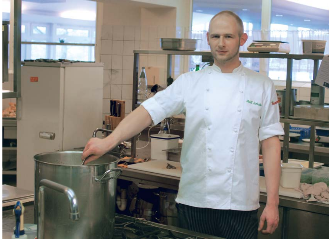
Was macht der Salzstreuer da in der Luft? Was sind das für Schattierungen im Bild? Am Saller See wird geforscht ...

zwar gute – glaube ich nur in Zusammenhang mit den Weinen, die wir zum Spargel empfehlen.“